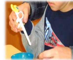
箸の練習 目と手の協応作業