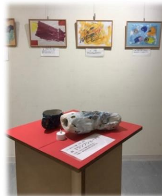
右の写真はい〜まART CLUB作品展の様子です