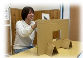
よーくみてね（注視）