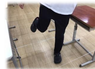
SST（ルールのある集団活動）